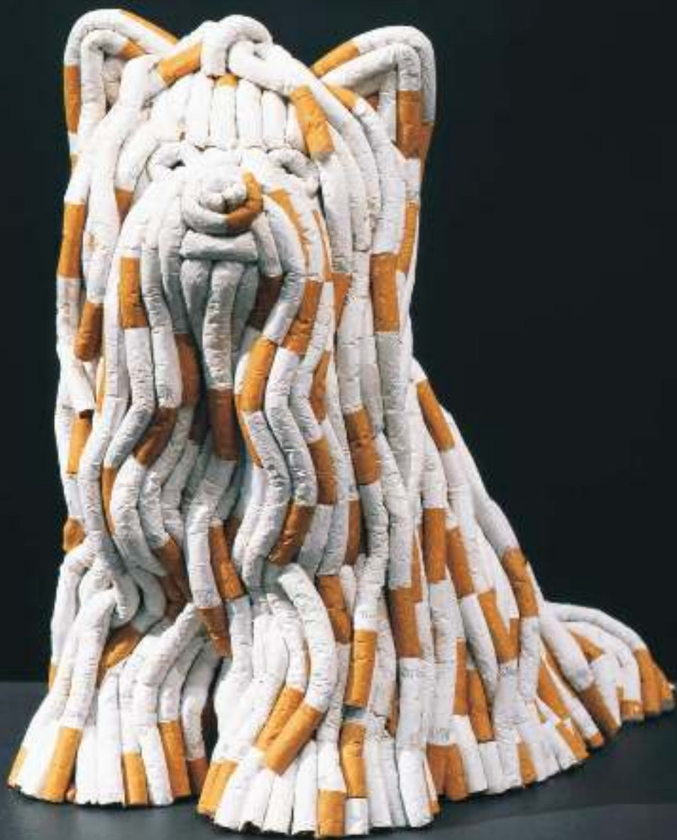
12 SARAH LUCAS Coco , 2005