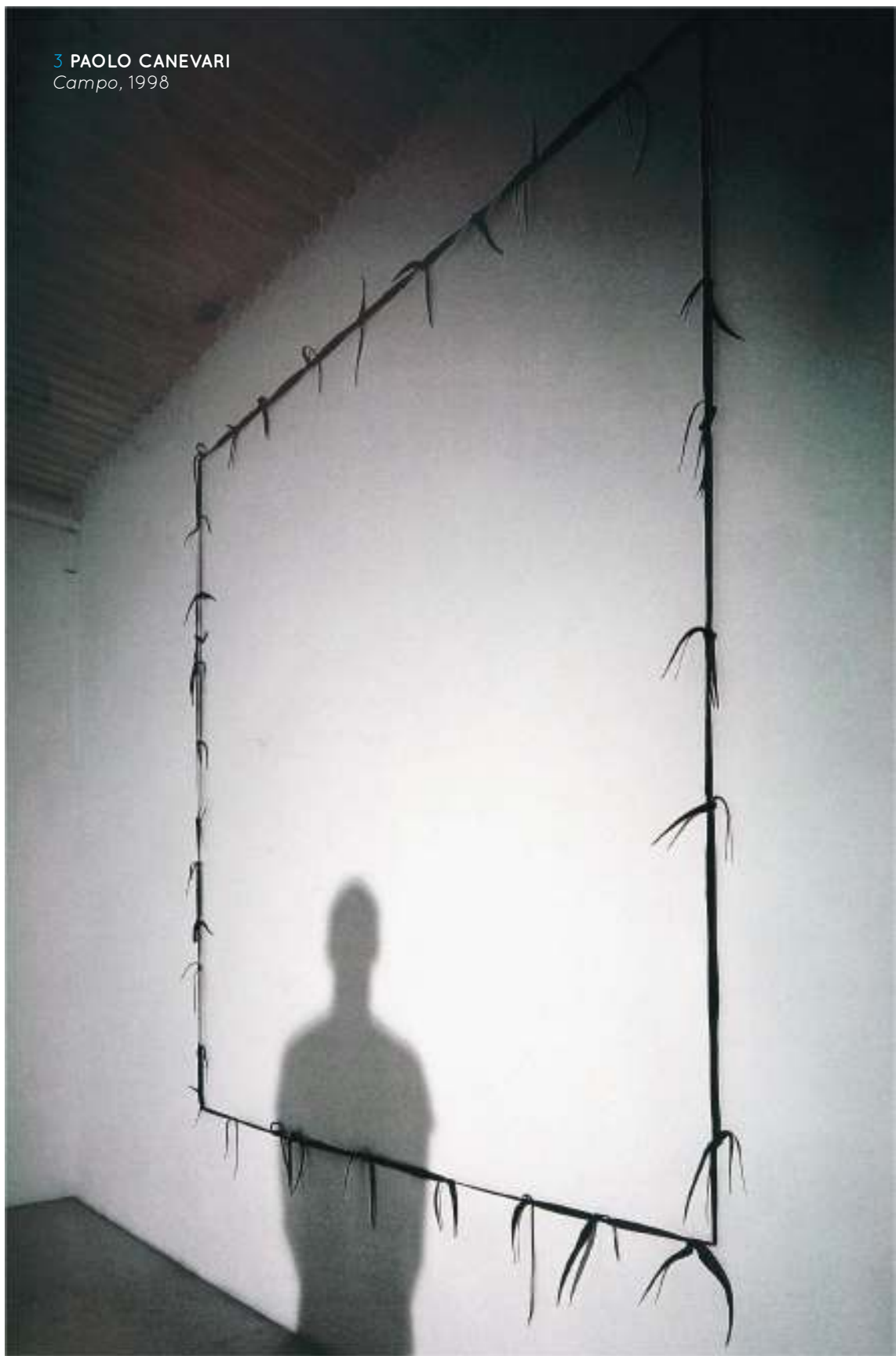
3 PAOLO CANEVARI Campo , 1998