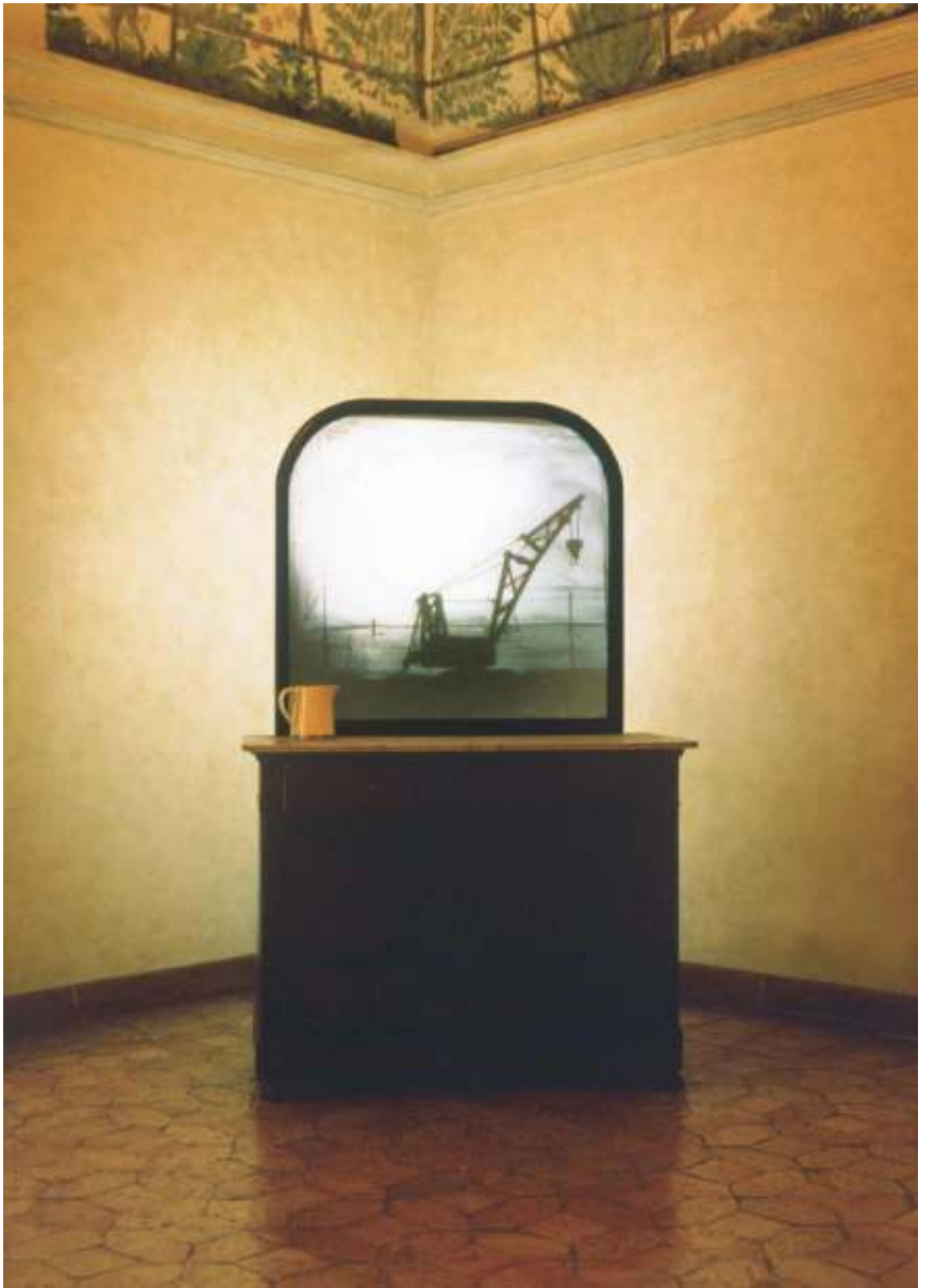
10 WILLIAM KENTRIDGE Sleeping on Glass, 1999