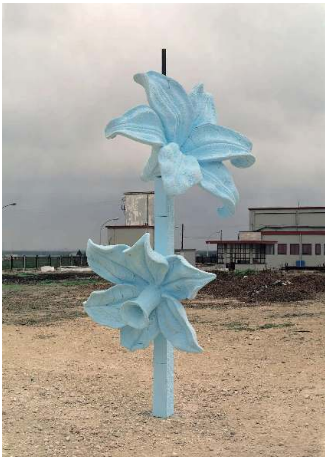
7 GIUSEPPE GABELLONE Senza titolo, 2002