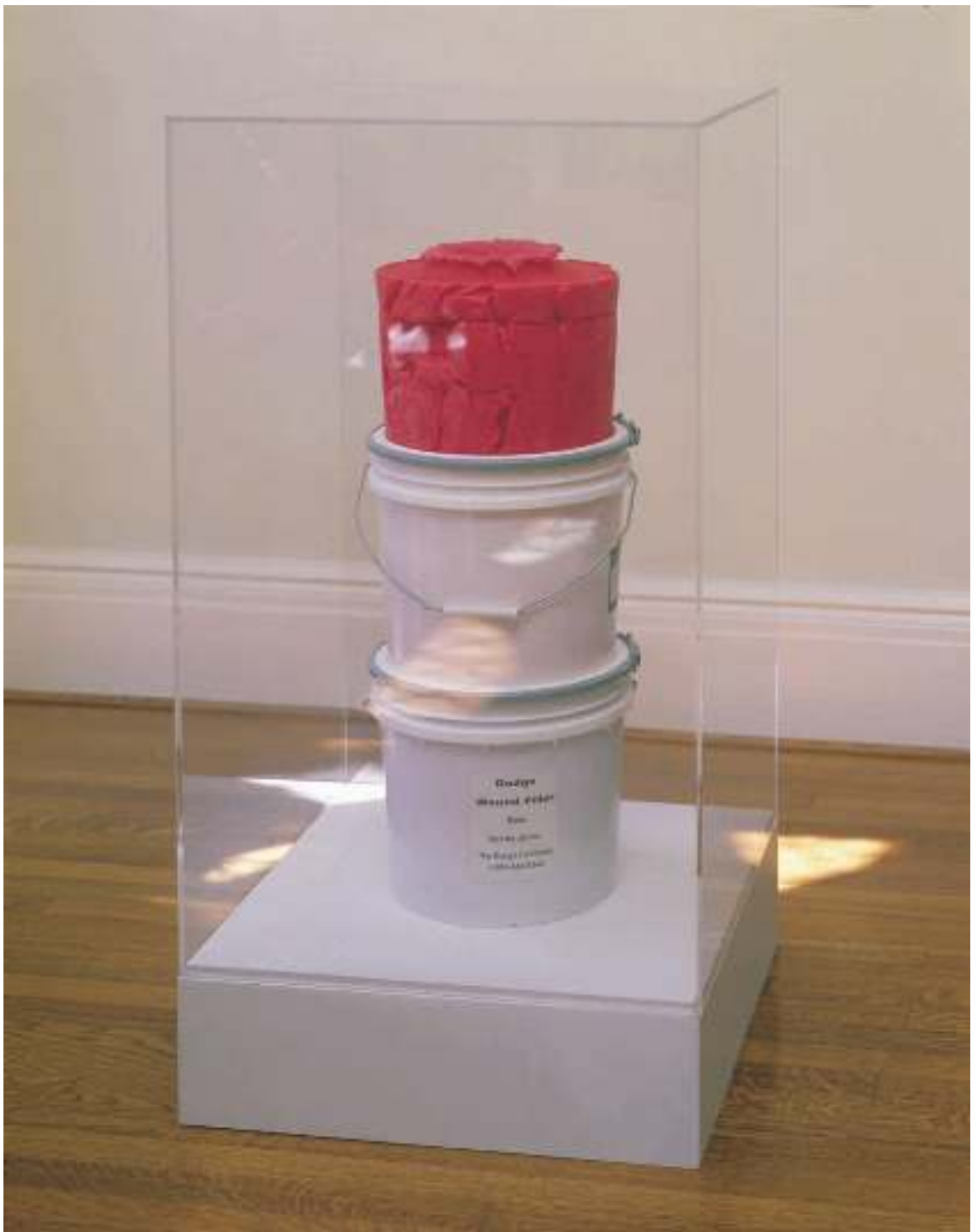
2 ROBERT BECK Roses are Red, Violence is Too , 2006