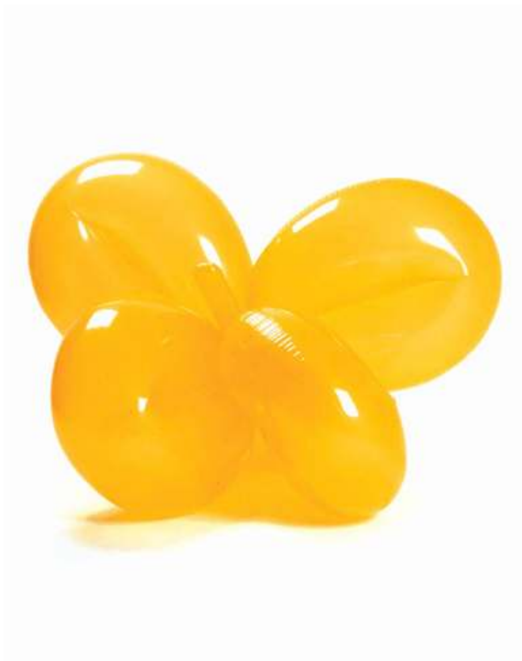
11 JEFF KOONS Inflatable Balloon Flower (Yellow) , 1997