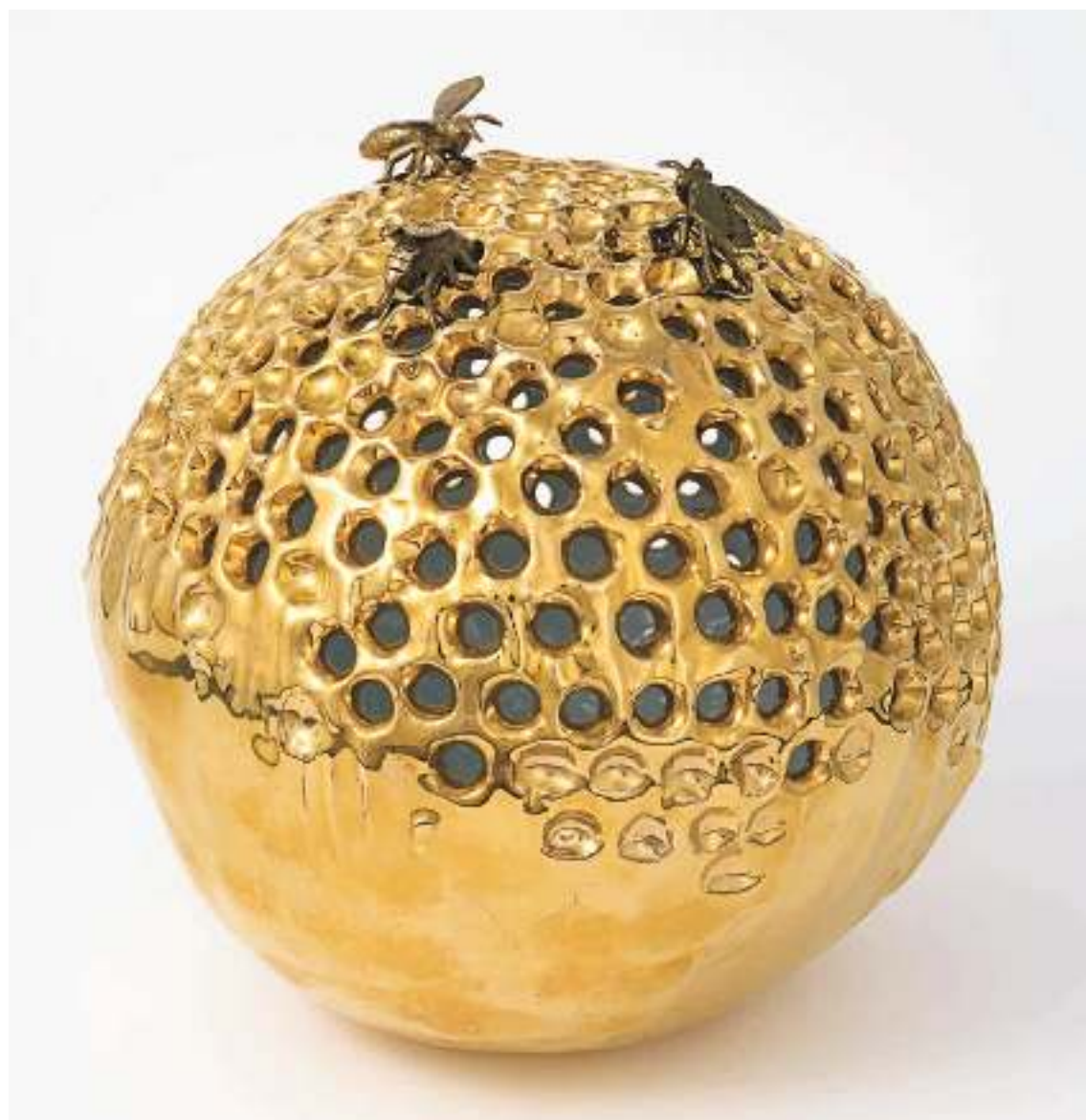
4 JESSICA CARROLL Favo , 2009