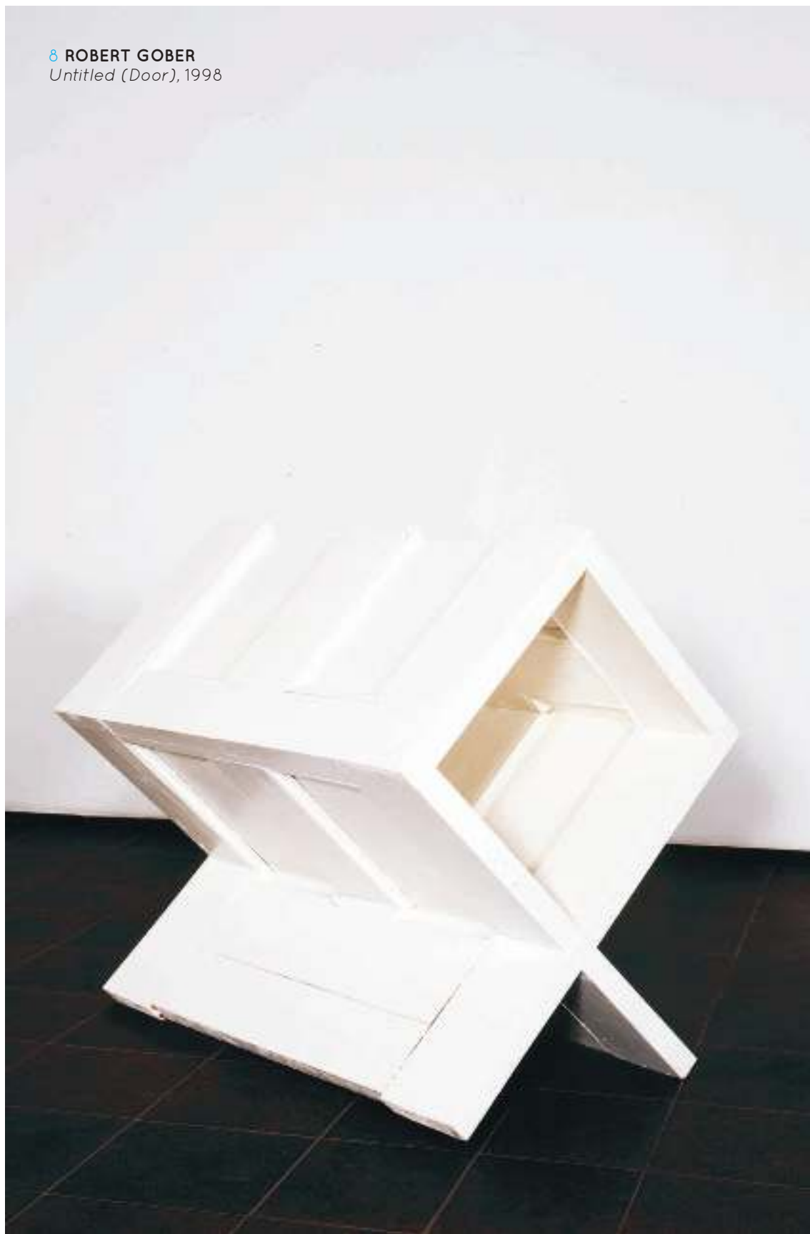
8 ROBERT GOBER Untitled (Door) , 1998