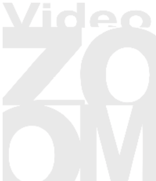
Nada a fazer (2009, 1') Produzione: Blade