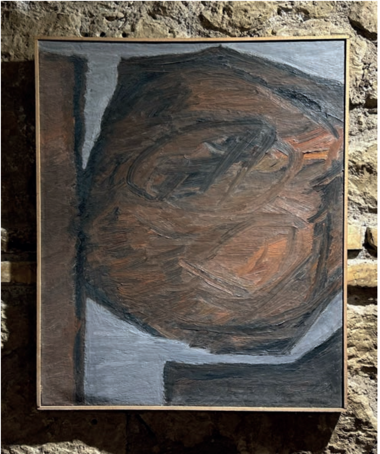
Frammento di paesaggio autunnale Olio su tela 76x63 cm 1971