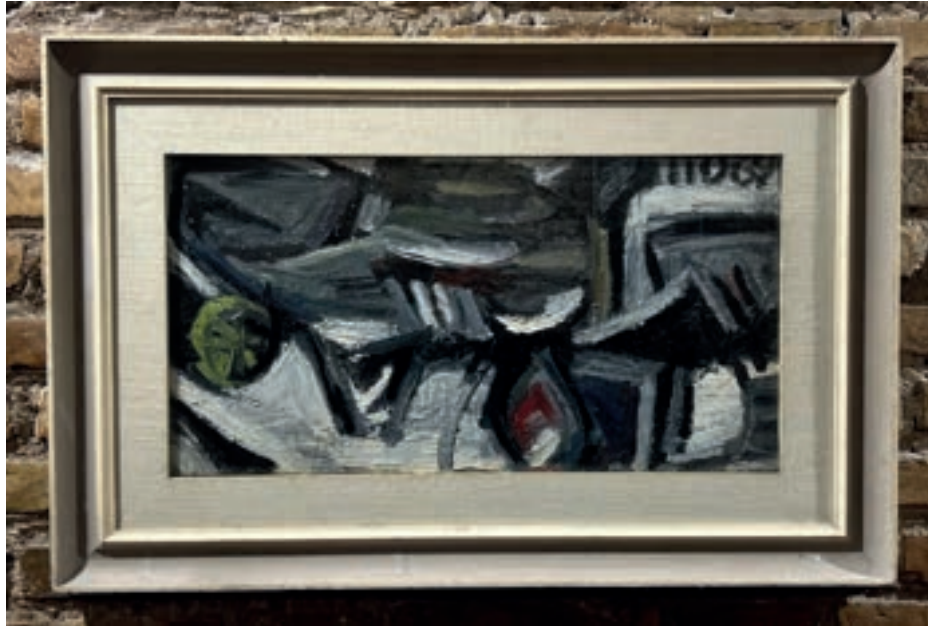
Natura morta Olio su tela 62x33 cm 1962