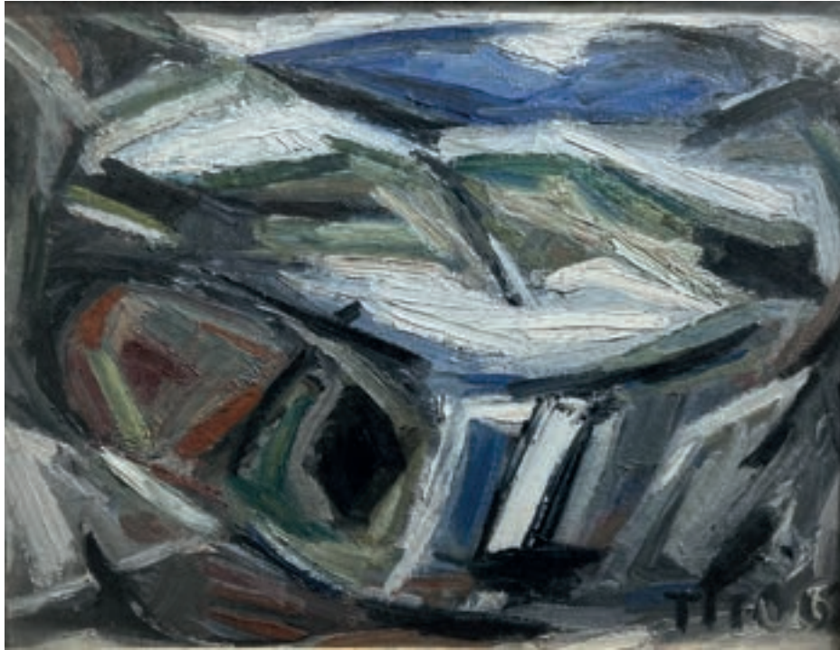
Monte Argentario Olio su tavola 54x42 cm 1962