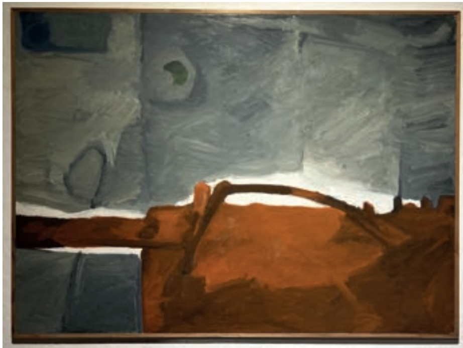
Presenza in città Olio su tela 110x80 cm 1973