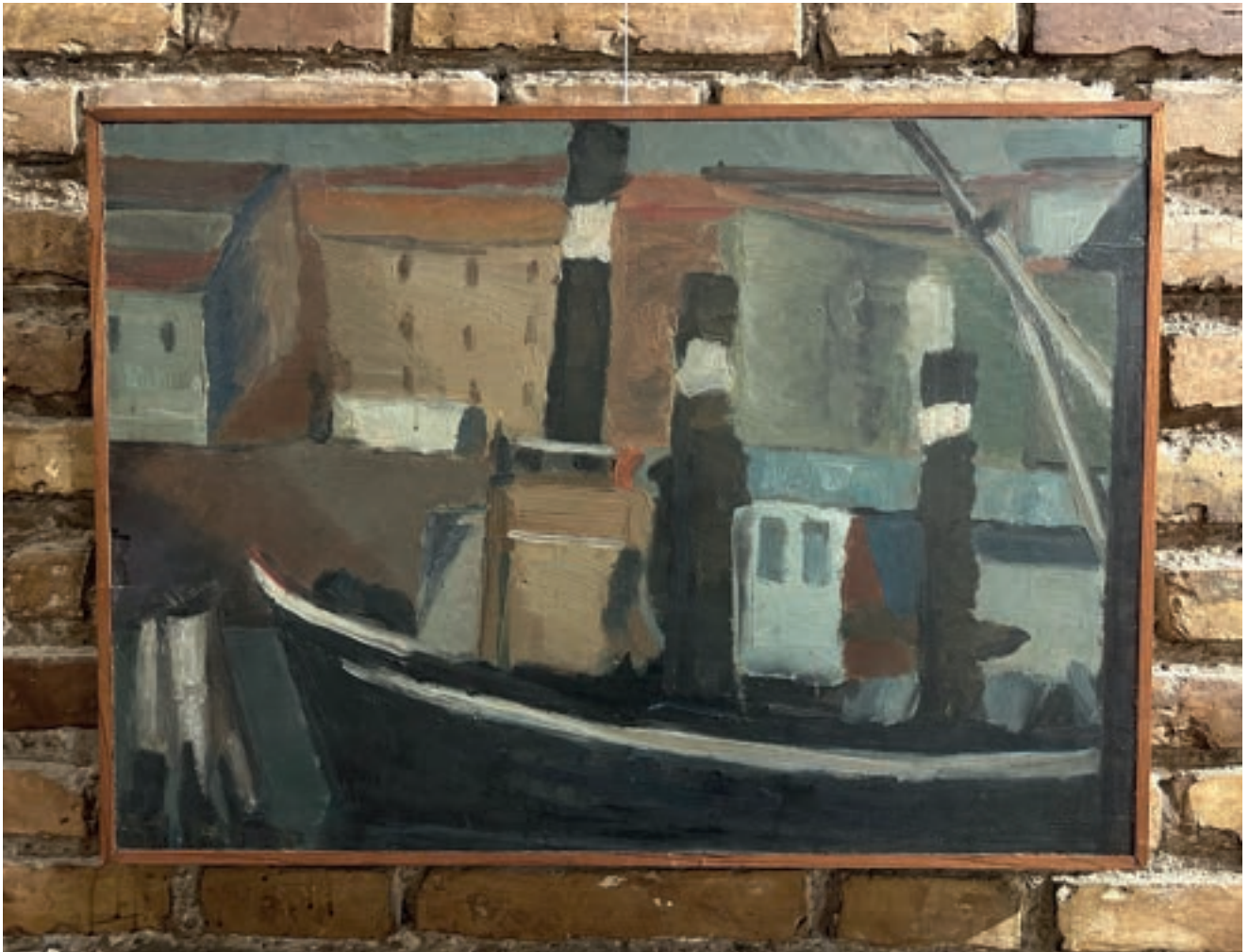
Porto di Livorno Olio su tela 69x50 cm 1956