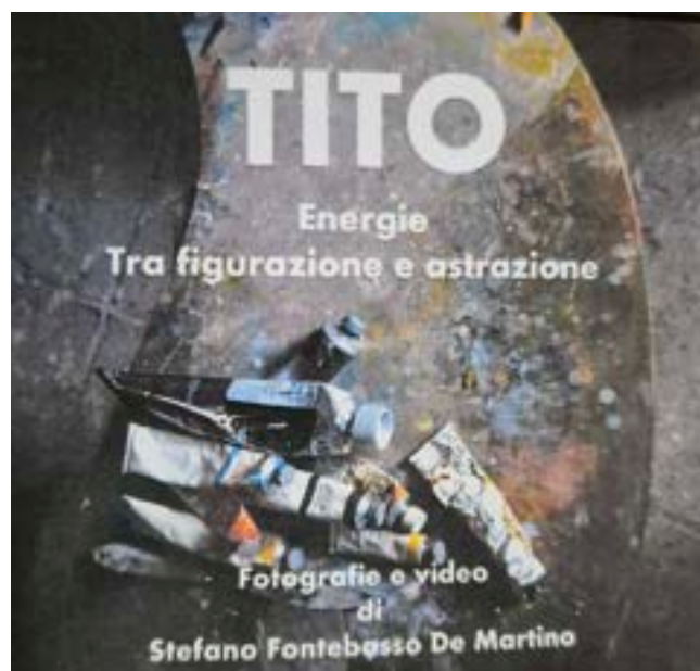
Copertina del CD "Tito: Energie Tra figurazione e astrazione"

Ha legato il suo nome all'arte contemporanea soprattutto grazie ad un ricco e prezioso archivio fotografico pazientemente costruito negli anni. È una folta documentazione su numerosi artisti di rilievo nazionale e internazionale ritratti in situazioni estemporanee, durante performance o azioni, al lavoro nei loro studi o nelle gallerie durante gli allestimenti delle mostre, immagini che colgono e valorizzano quell'istante come momento di un più ampio processo creativo che investe il fare arte. Dal 1993, utilizza anche la fotografia digitale per le sue ricerche visive.