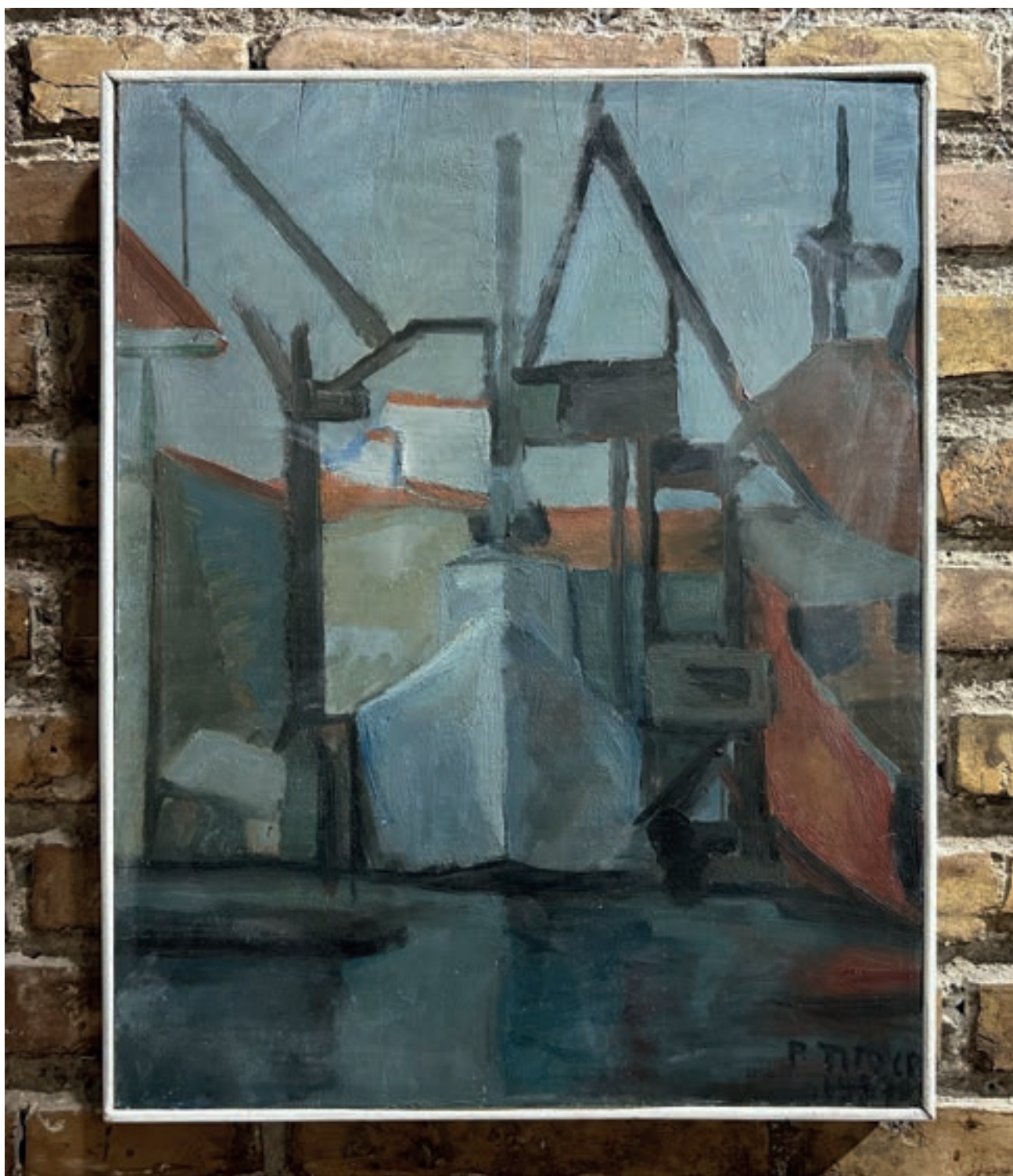
Porto di Livorno Olio su tela 69x50 cm 1956