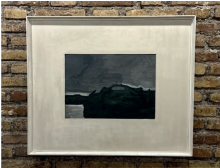
Presenza in città Olio su tela 48x34 cm 1973