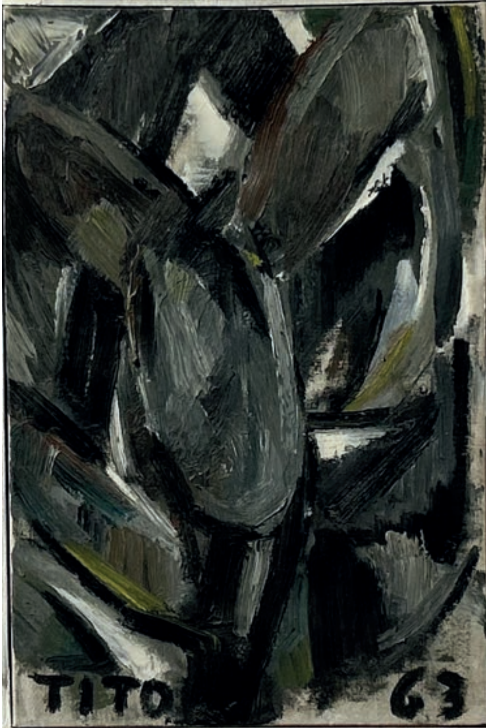
Fichi d'India Olio su tela 45x30 cm 1963