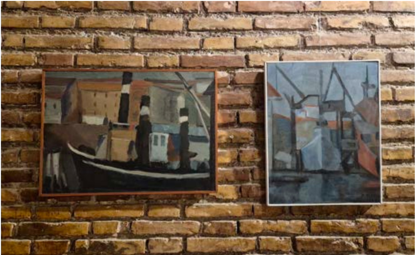
Il Porto di Livorno 1956 (I,II)