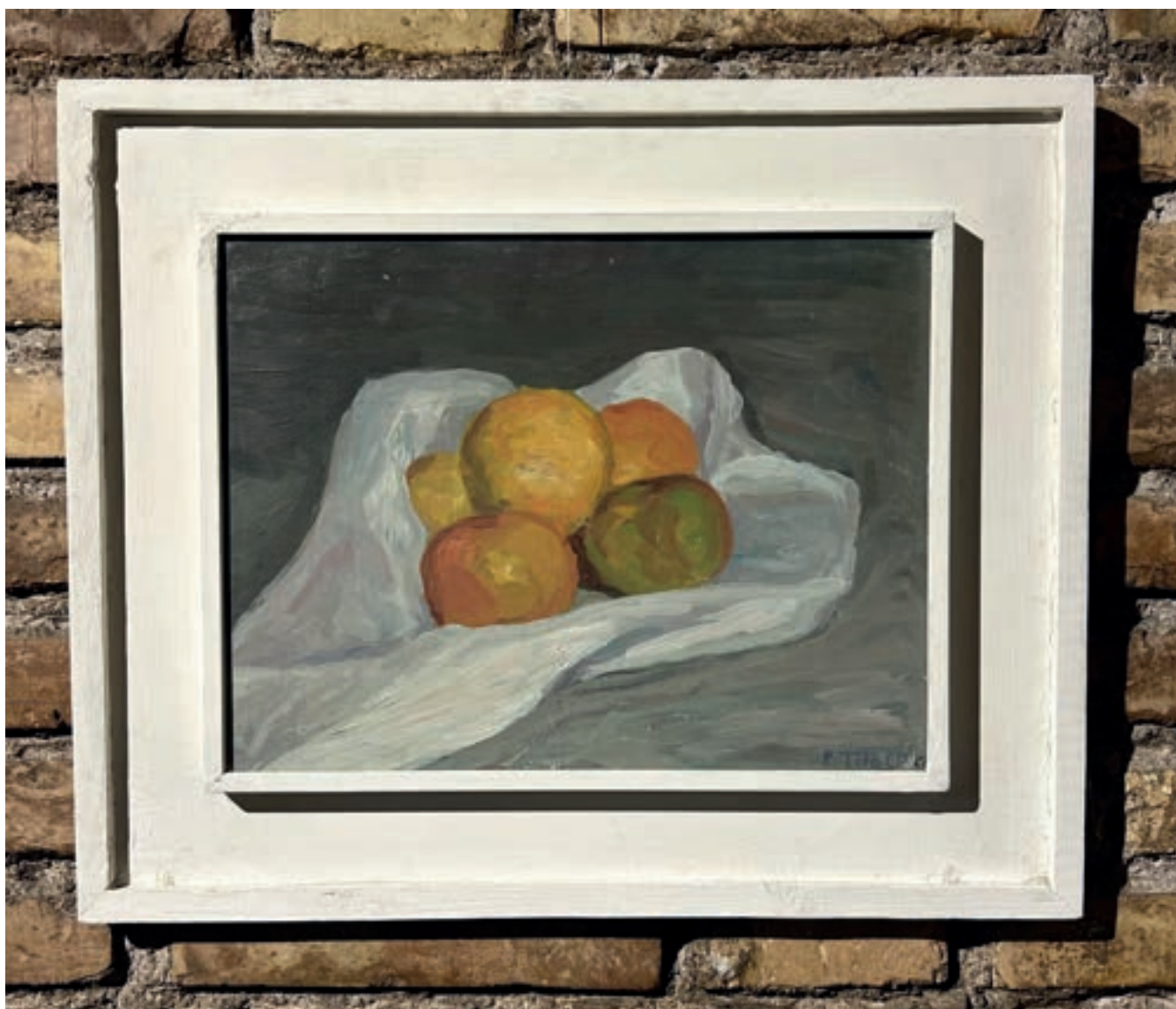
Natura morta Olio su cartone 41x32 cm 1955